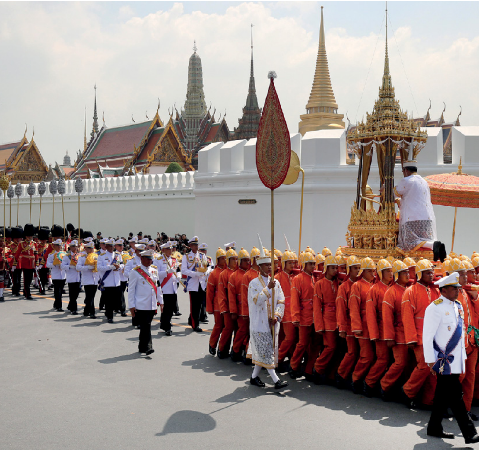
ขบวนพระบรมราชอิสริยยศ ริ้วขบวนที่ 4 เชิญพระโกศพระบรมอัฐิประดิษฐานบนพระที่นั่งราเชนทรยาน อัญเชิญสู่พระที่นั่งดุสิตมหาปราสาท และพระพอบพระบรมราชสรีรางคารประดิษฐานบนพระที่นั่งราเชนทรยานน้อย อัญเชิญไปประดิษฐานพิทักษ์ ณ พระศรีรัตนเจดีย์