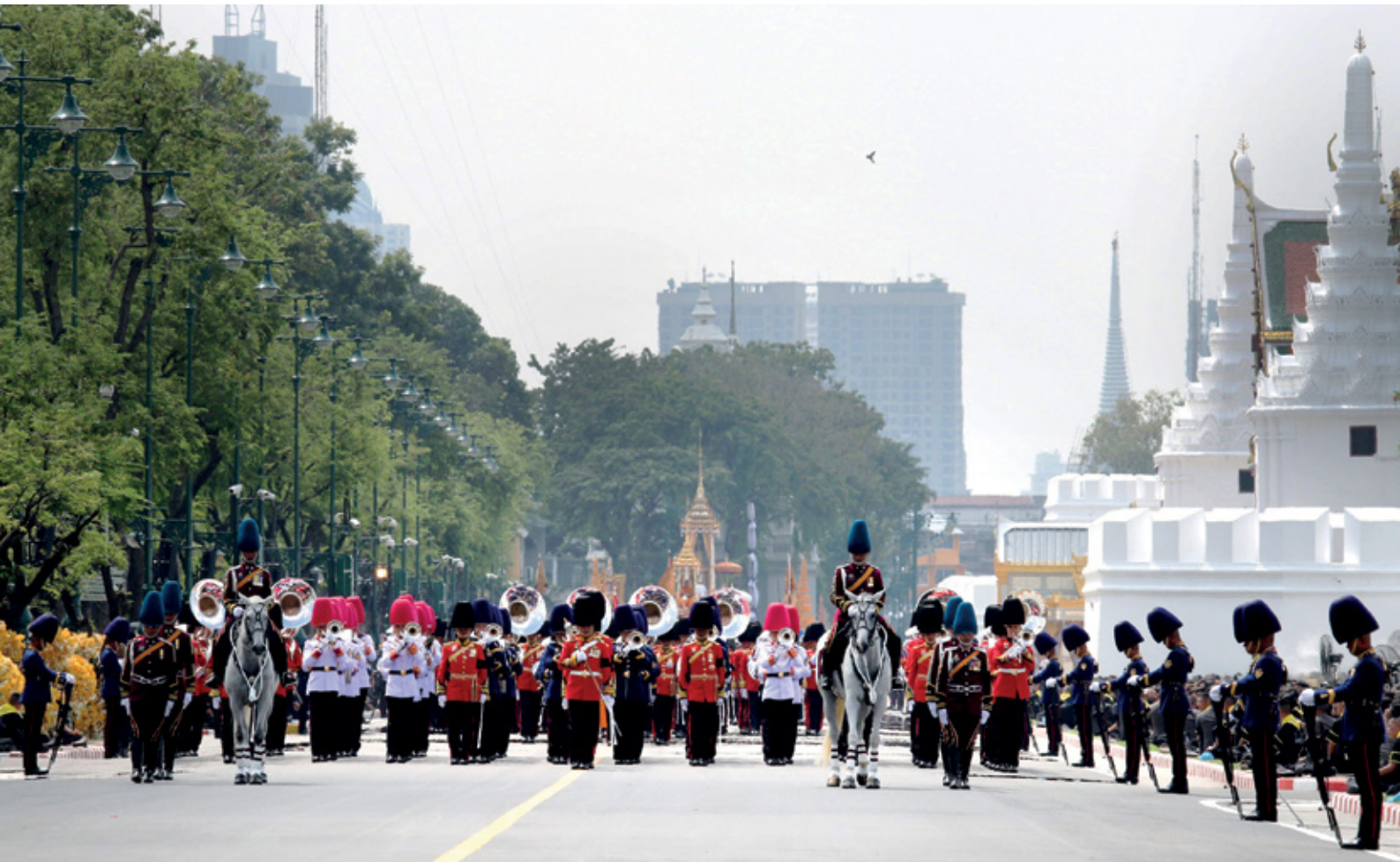
ขบวนพระบรมราชอิสริยยศ รั้วขบวนที่ 1 เชิญพระโกศทองใหญ่โดยพระยานมาศสามลำคาน จากพระที่นั่งดุสิตมหาปราสาทไปยังบริเวณวัดพระเชตุพนวิมลมังคลารามราชวรมหาวิหาร และอัญเชิญพระโกศทองใหญ่ขึ้นประดิษฐานในบุษบกพระมหาพิชัยราชรถ เข้าสู่รั้วขบวนที่ 2 ยাত্রาสู่มณฑลพิธีท้องสนามหลวง