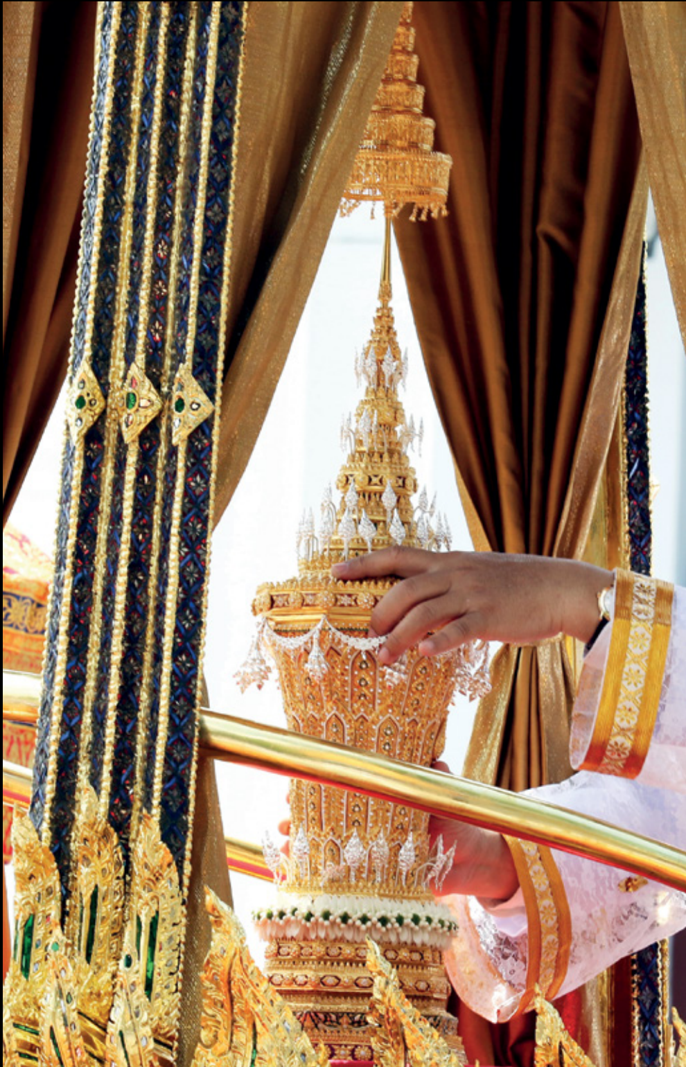
พระโกศพระบรมอัฐิประดิษฐานบนพระที่นั่งราเชนทรยาน พระโกศสร้างด้วยทองคำลงยาทรง 9 เหลี่ยม ประดับเพชรเจียรไนสีขาวกว่า 5,000 เม็ด ฝาพระโกศทรงมงกุฎเกี่ยวมาลัยทอง ส่วนยอดเป็นพุ่มข้าวบิณฑ์และสุวรรณฉัตร