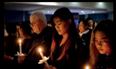
คนไทยในซานฟรานซิสโกนับพันคนรวมตัวกันบริเวณซานฟรานซิสโก ซิตี้ ฮอลล์ ในขณะที่พี่น้องชาวไทยในเมืองเลสเตอร์ ประเทศอังกฤษ รวมตัวกันที่สนามคิงเพาเวอร์ สเตเดียม เพื่อถวายความอาลัยแด่พระบาทสมเด็จพระปรมินทรมหาภูมิพลอดุลยเดช ในบรรยากาศหม่นเศร้า