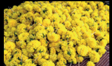
ประชาชนร่วมแรงร่วมใจเตรียมงาน จัดสถานที่สำหรับพิธีวางดอกไม้จันทน์ ณ พระเมรุมาศจำลอง บริเวณสวนสาธารณะเฉลิมพระเกียรติ 6 รอบพระชนมพรรษา ศูนย์ราชการจังหวัดราชวาส ตำบลโคกเคียน อำเภอเมือง จังหวัดราชวาส และพระเมรุมาศจำลอง บริเวณมณฑลพิธี ณ ลานหน้า อบจ. จันทบุรี จนแล้วเสร็จอย่างงดงาม สมบูรณ์