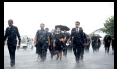
พลกนิกรทุกหมู่เหล่าตั้งมั่นเดินทางมาร่วมพิธีวางดอกไม้จันทน์ ณ ศูนย์ประชุมและแสดงสินค้านานาชาติจังหวัดเชียงใหม่ โดยไม่ย่อท้อต่อสภาพอากาศใดๆ